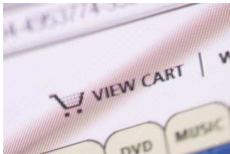
Botón de pago por internet