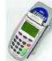
Datafono virtual y Físico