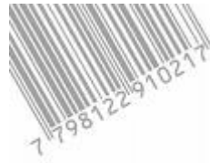
Código de Barras